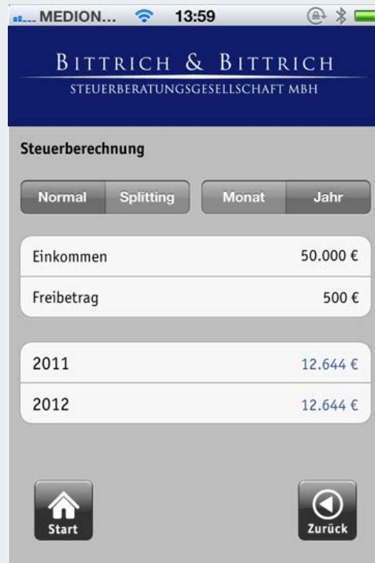
Abb. 5 Steuerberechnung