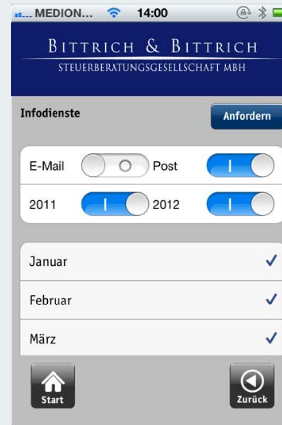
Abb. 3 Infodienst anfordern