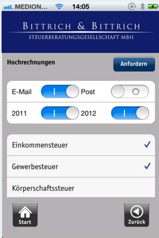
Abb. 4 Hochrechnung anfordern