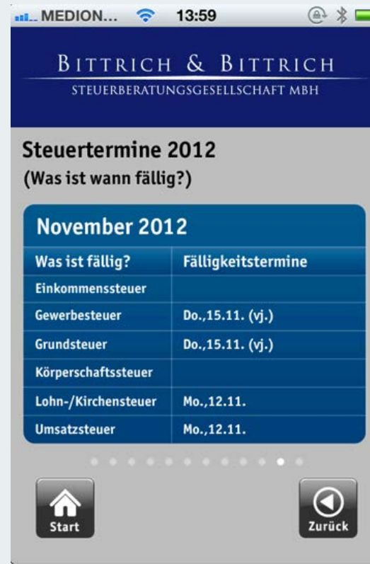
Abb. 6 Fällige Steuertermine