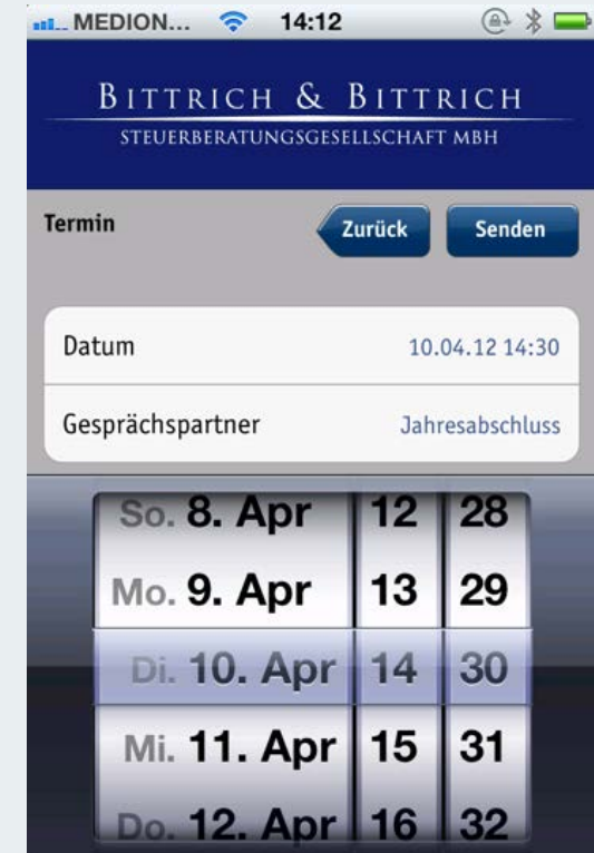
Abb. 7 Terminwunsch